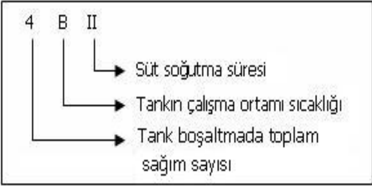
Őekil 1. St sođutma tankları sođutma performans sınıfı aıklaması

alıřma ortamı sıcaklıđına ve tanka konulan stn sođutma sresine gre sınıflandırılmaktadırlar. Sz konusu sınıflandırma bilgileri sırasıyla her sođutma tankının zelliđini ortaya koymakta ve etiket bilgilerinde yer alması gerekmektedir. rneđin; 2 A III, 4 B II, 2 C I vb. Bu iřaretleme ile ilgili aıklamalar Őekil 1'de verilmektedir (Gnhan ve ark., 2006).